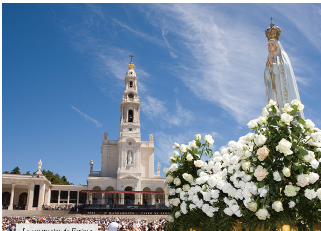
Le sanctuaire de Fatima

compagnie pendant quinze minutes en méditant sur les quinze mystères du Rosaire, en esprit de réparation, je promets de les assister à l'heure de la mort avec toutes les grâces nécessaires pour le salut de leur âme ».