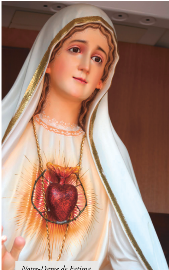
Notre-Dame de Fatima

Si nous ouvrons ce livre de vie et en tournons les pages en y cherchant les lignes fortes, nous sommes naturellement conduits à la dévotion au Cœur immaculé et douloureux de Marie. Comme un blason qui orne chaque pièce d'un palais, le cœur de Marie apparaît à chaque apparition de Fatima et leur donne un cachet unique.