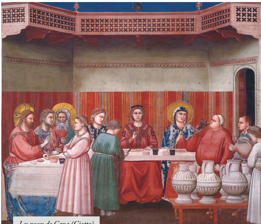
Les noces de Cana (Giotto)

traverse l'Église 4 . Celle-ci subit toujours plus aujourd'hui ce que Mgr Lefebvre appelait "le coup de maître de Satan" : « Diffuser les principes révolutionnaires par l'autorité de l'Église elle-même. 5 » Nous voyons en effet les autorités de l'Église, depuis le siège de Pierre jusqu'au curé de paroisse, porter directement atteinte à la foi catholique par un humanisme dévoyé qui, plaçant au pinacle le culte de la conscience, détrône d'autant Notre Seigneur Jésus-Christ. Ainsi, la royauté du Christ sur les sociétés humaines est simplement ignorée, voire combattue, et l'Église est saisie par cet esprit libéral qui se manifeste spécialement dans la liberté religieuse, l'œcuménisme et la collégialité. À travers cet esprit, c'est la nature même de la Rédemption réalisée par le Christ qui est remise en cause, c'est l'Église catholique unique arche du salut qui est niée dans les faits. La morale catholique elle-même, déjà ébranlée dans ses fondements, est renversée par le pape François, par exemple lorsque celui-ci ouvre explicitement la voie à la communion des divorcés « remariés » vivant maritalement. Cette attitude dramatique des auto-