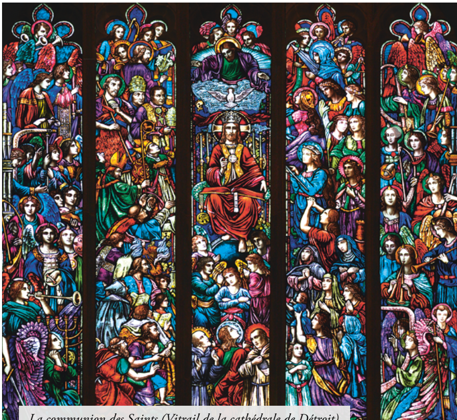
La communion des Saints (Vitrail de la cathédrale de Détroit)

ne sont pas les Droits de l'homme, ces Droits de l'homme qui ont été forgés au moment de la Révolution, pour continuer la Révolution.