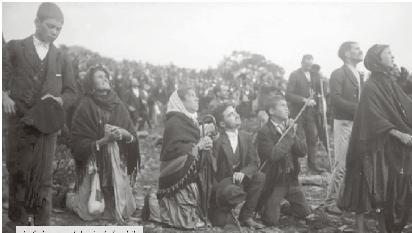
La foule contemple le miracle du soleil

Vierge. Elle se présente nimbée de lumière au-dessus d'un chêne vert à la Cova da Iria.