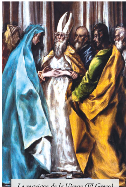
Le mariage de la Vierge (El Greco)

À ceux qui objecteraient qu'une telle pratique serait désormais invalide puisque les autorités ecclésiastiques offrent une possible délégation de l'Ordinaire, nous leur répondrons que l'état de nécessité qui légitime notre façon de faire n'est pas canonique mais dogmatique, que l'impossibilité de recourir aux autorités en place n'est pas physique mais morale. Nous ne voulons tout sim-