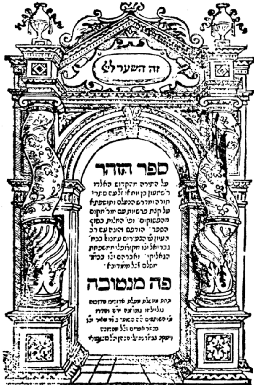
Fac-simile della copertina dell'edizione «Princeps del Zohar» (Mantua 1560)

interpretazione della Rivelazione Divina, ossia nella Kabala e nel Talmud . E' per loro cosa sacra perpetuarlo ed estrinsecarlo.