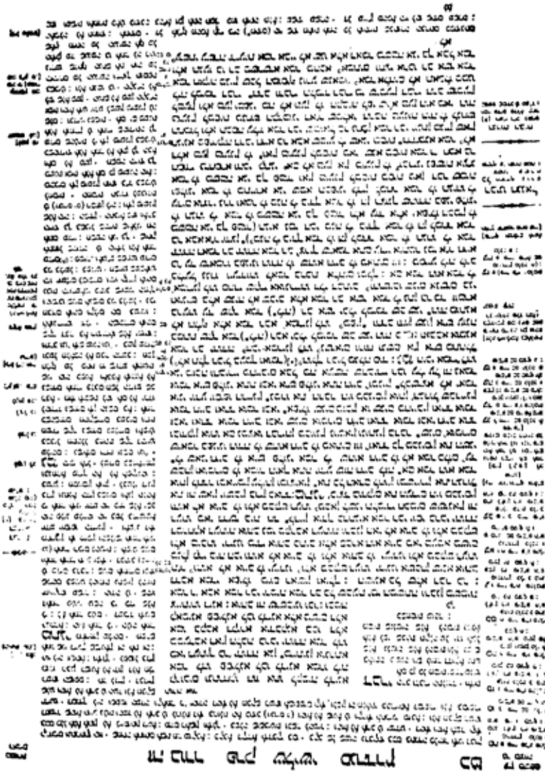
Fac-simile di una pagina del Talmud babilonico